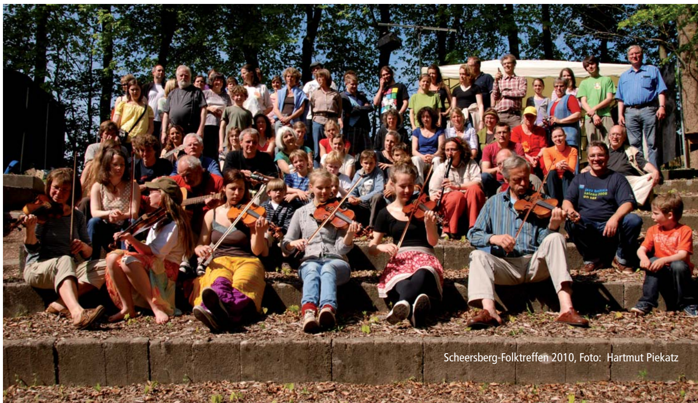
Scheersberg-Folktreffen 2010