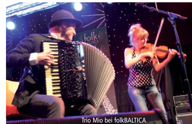
Trio Mio bei folkBALTICA