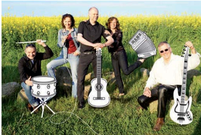
Guitavio am 23. Febr. im Schmidt-Haus in Schönkirchen und am 16. + 17. März im Alten Pastorat in Wrist (mit Liederjan)

Impressum: Herausgeber: LAG Folk Schleswig-Holstein e.V. Geschäftsstelle, Redaktion und Termine c/o Bernd Künzer Strandstr.11 24235 STEIN Tel. 04343-9249 info@lagfolk.de