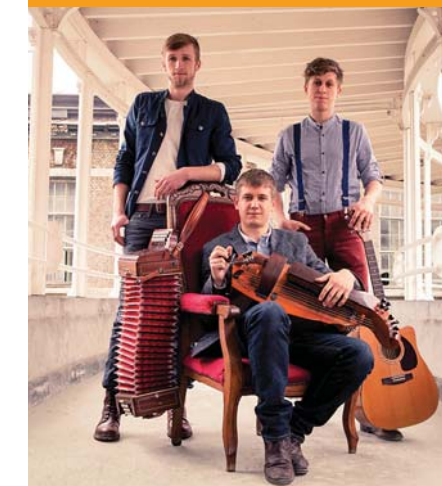
Doppelkonzert auf dem Scheersberg am 3. Juni 2017 mit Trio Dhoore und Floating Sofa Quartet