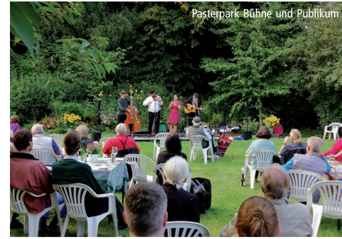
Pasterpark Bühne und Publikum